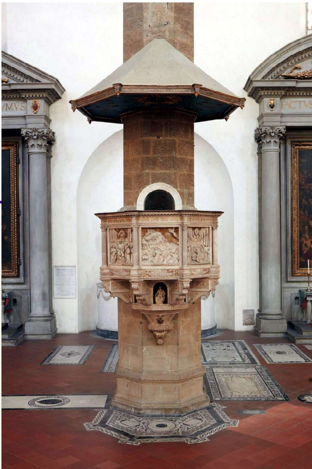
Il pulpito in Santa Croce di Firenze

gre, quattro orsi, quattro lupi, sei aquile. Passa in mezzo alla città il fiume Arno che si naviga sino a Pisa. Il ponte sopra esso fiume dove stanno gli orefici è lungo passi 120, largo 24 [ Ponte Vecchio ].