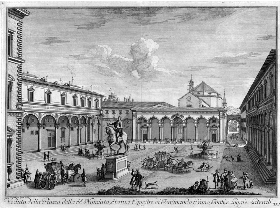
Piazza della SS. Annunziata, incisione di Giuseppe Zocchi, da Vedute della città di Firenze, 1744.

Abbiamo già scritto riguardo alle poste di fermata di alcune importanti vie italiane citate in un Itinerario dal sospellese Sigismondo Alberti cistercense († dopo 1742). Accompagnano, in tale manoscritto, i suoi viaggi e in particolare quelli di andata e ritorno diretti a Roma. Questi in più sono descritti con gradevoli e interessanti notizie.