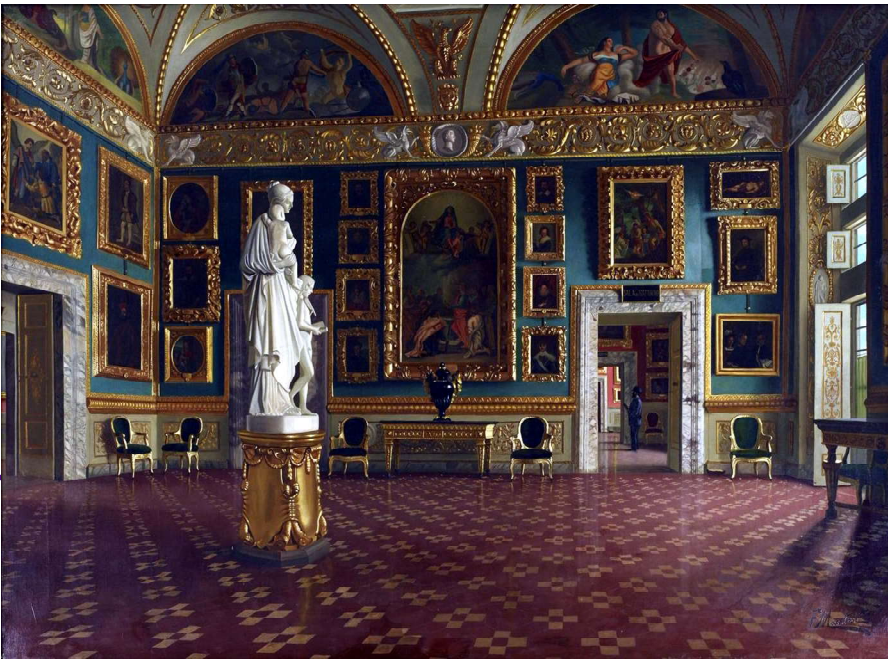
La Sala dell'Iliade a Palazzo Pitti, foto di Francesco Maestosi, da MeisterDrucke.

Lì 18 aprile, da Tavernelle, sguazzato il torrente Pesa e scorsa la terra di San Cassiano [ San Casciano ], son giunto alle dieci in Firenze in tempo che partiva per Roma una confraternita di fiorentini in numero di 80 vestiti di bianco, alla partenza de' quali vi era aspettatrice quasi tuta la città concorsa, e perciò mi fu comodo vedere la frequenza e l'abondanza del popolo fiorentino [ era una sua caratteristica ammirata dai viaggiatori ].